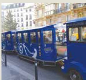
Page de couverture : Train touristique de Paris.

Bulletin trimestriel de l'association Les Auxiliaires des Aveugles, reconnue d'utilité publique en 1974.